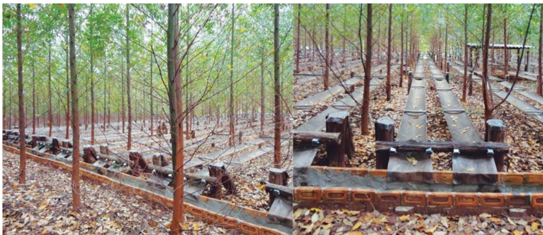
Figura 1 – Delineamento experimental com árvores de E. grandis . Detalhe da redução de chuva por faixas de polietileno. Figure 1 – Experimental design with E. grandis trees. Detail of rain reduction by polyethylene strips.

Para avaliação das fibras, foram retiradas amostras dos corpos de prova nas três posições radiais e submetidas ao processo de maceração, segundo o método Franklin (JOHANSEN, 1940). As lâminas histológicas com as fibras foram analisadas em microscopia de luz e coletadas 40 imagens de fibras por lâmina, para a mensuração do comprimento (ampliação de 40 vezes), largura e diâmetro do lume (ampliação de 400 vezes).